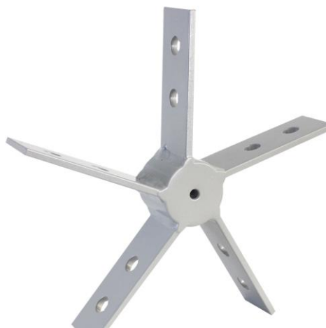
pav. 2 T-STAR jungties pavyzdys