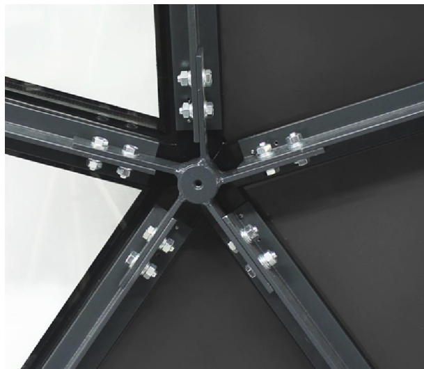
pav. 3 Kupolo konstrukcijos varžtinė jungtis

Plieninė kupolo konstrukcija inkariniais varžtais tvirtinama prie betoninio pagrindo inkariniais varžtais.