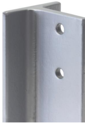
pav. 1 T Profilio pavyzdys

Kupolo konstrukcija su daryta iš “T” skerspjūvio profilių tarpusavyje sujungtų T-STAR sistemos jungčių. Konstrukcija dažyta miltelinių būdų. Plienas S235, antikorozijos klasė C3.